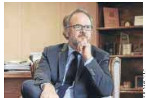
Presidente de la Sofofa, Bernardo Larraín Matte.

Recalcó que entiende la postura de India de reaccionar frente a Estados Unidos con aranceles a las exportaciones de nueces, pero "Chile se vio perjudicado por esa reacción, así que le vamos a pedir una reunión a la embajadora de Estados Unidos con el objeto de manifestarle nuestra preocupación como sector privado chileno".